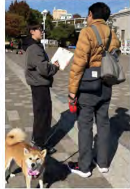
こうべ動物共生センターのことを知っていますか